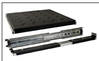
półka z prowadnicami