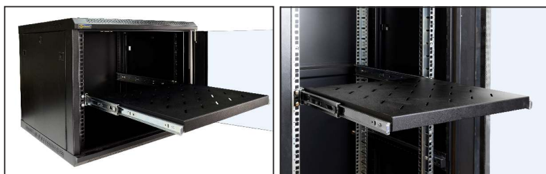
pełny wysuw półki