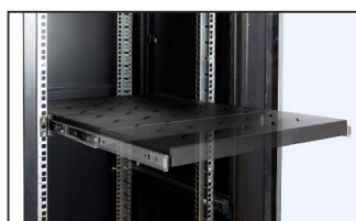
pełny wysuw półki