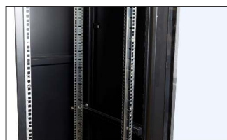
pusta szafa RACK 19"