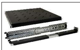
półka z prowadnicami