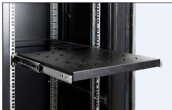
pełny wysuw półki