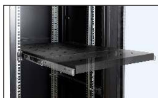
pełny wysuw półki