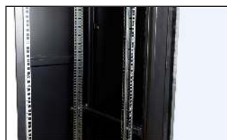
pusta szafa RACK 19"